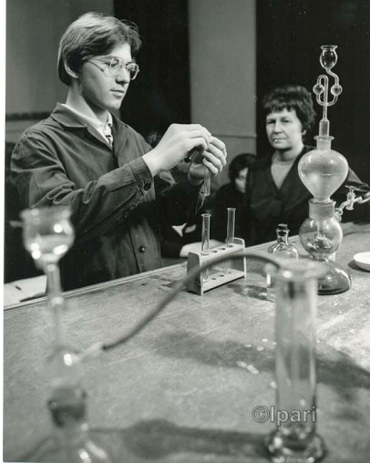
1949 Vegyész technikus

Az iskola 1949-ben alakult, az idén 70 éves.