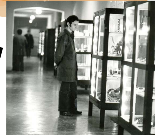
1958 Színesfém-feldolgozó technikus